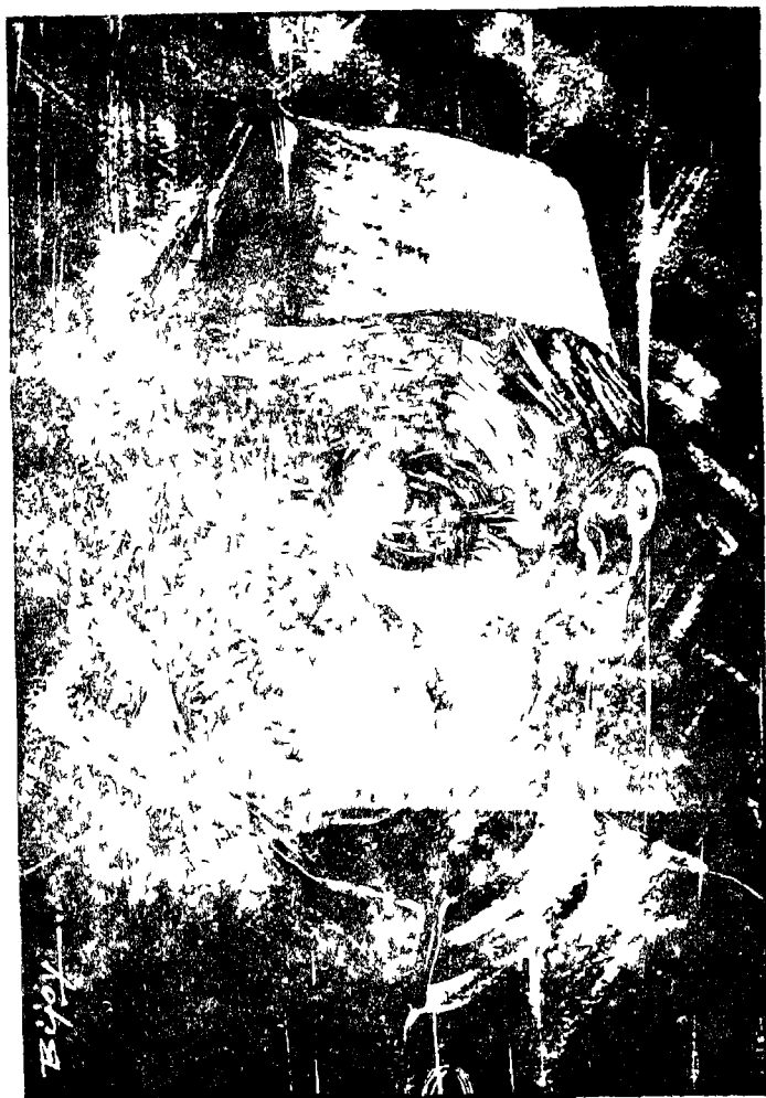
शान्त स्वर्गीय डा० राजेन्द्र प्रसाद